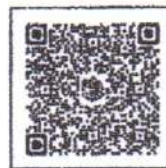
Google Form แบบประเมินฯ