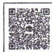
Google Form แบบสำรวจฯ