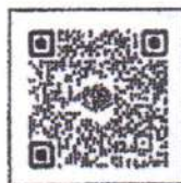
ลิงก์ส่งมาด้วย

กองตรวจสอบภาครัฐ กลุ่มงานนโยบายการตรวจสอบภาครัฐ โทร. ๐ ๒๑๒๗ ๗๐๐๐ ต่อ ๖๕๑๒ ๖๕๐๘ โทรสาร ๐ ๒๑๒๗ ๗๑๒๗ ไปรษณีย์อิเล็กทรอนิกส์ saraban@cgd.go.th