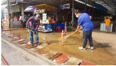
๒๔. โครงการสนับสนุนกิจกรรมช่วยเหลือบรรเทาทุกข์ กิ่งกาชาดอำเภอเวียงป่าเป้า ประจำปี พ.ศ. ๒๕๖๖