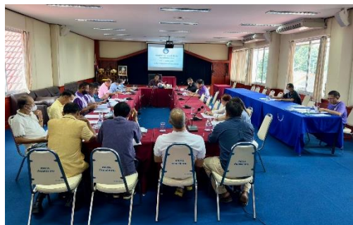
๒๖. โครงการรณรงค์ต่อต้านยาเสพติด เทศบาลตำบลแม่ชะจาน ประจำปีงบประมาณ พ.ศ. ๒๕๖๖